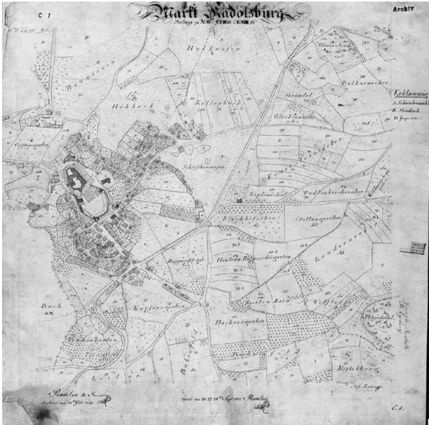
Markt Cadolzburg und Umgebung (1827), Bezugsort der Lokalen Musik (s.a. S. 128 „The Spirit of Place“)