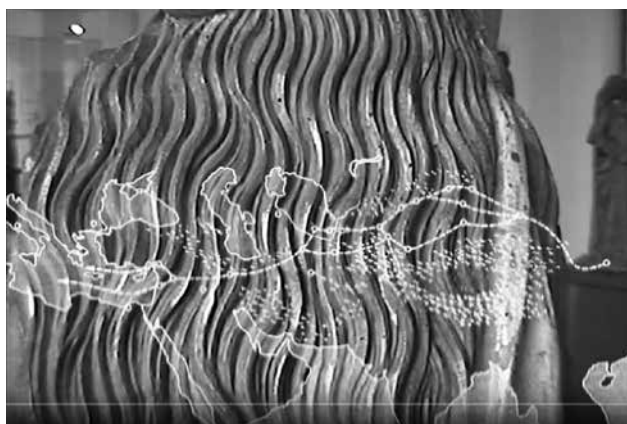
Filmstill aus Seidenstraße